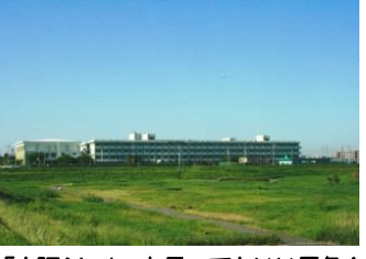
本校の制服です。1学年240名。「大阪No.1」と言ってもいい景色!